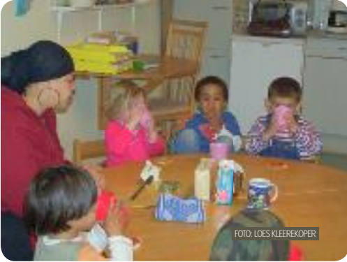
VERZORGING IS VAAK SAMEN.