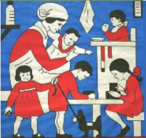
ILLUSTRATIE: STICHTING KINDEROPVANG HILVERSUM, 1906