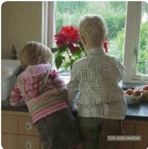
THUIS IS ANDERS.

Hoe noemen we de opvoeders van jonge kinderen in kindercentra? Tot voor kort was dat eenvoudig: leidsters. Maar de vrouwelijke vorm doet geen recht aan de mannen. Hier en daar wordt de term groepsleiding gebruikt. Het begrip pedagogisch medewerker wordt gangbaarder. Seksneutraal en met aandacht voor het pedagogische aspect. Daarom is in het Pedagogisch kader gekozen voor pedagogisch medewerker.